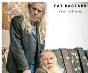
FAT BASTARD Promotions

We gaan met eigen vervoer ( afspreken met een 4-tal chauffeurs ) 20 minuten rijden Veerstraat 14 9160 LOKEREN De tickets kosten 26 € per persoon (rij P, stoel 1 tot 15)